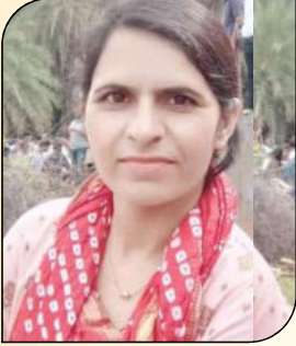
कमला कुमारी गढ़वाल रा.उ.मा.वि., पनलावा ( सीकर )