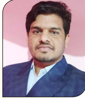
केशर काछवाल रा.उ.मा.वि., रुल्याणा माली ( सीकर )